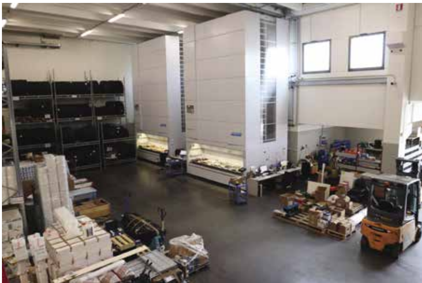
UNO SCORCIO DEL MAGAZZINO RICAMBI. DUE IMPIANTI VERTICALI AUTOMATICI CONSENTONO UNA MIGLIORE GESTIONE DELLO SPAZIO E TEMPI RAPIDI DI MOVIMENTAZIONE E STOCCAGGIO

attenzione all'innovazione tecnologica e allo sviluppo sostenibile, come dimostrano il progetto di welfare volto a incrementare il benessere del lavoratore e della sua famiglia e l'acquisto di mezzi dotati di tecnologia all'avanguardia nella riduzione delle emissioni inquinanti, per un maggiore rispetto ambientale”.